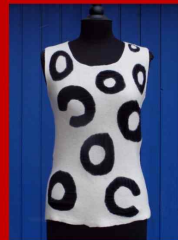
Marianne Wurst Kleidung und Accessoires