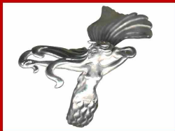
Runa Verdandi Schmuck u. Skulpturen