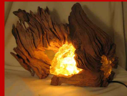
Manfred Reuter Lichtobjekte