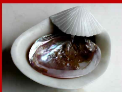
Giorgio di Montelupo Brunnen u. Schalen aus Naturstein